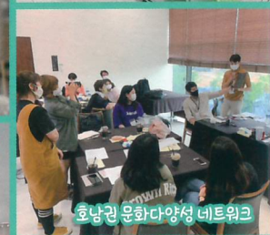
효남권 문화다양성 네트워크