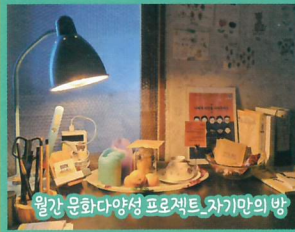
월간 문화다양성 프로젝트 자기만의 방