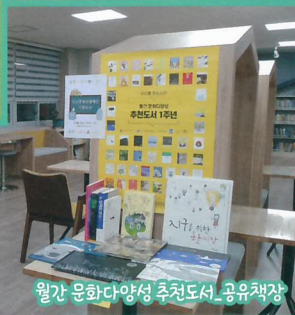
월간 문화다양성 추천도서_공유책장